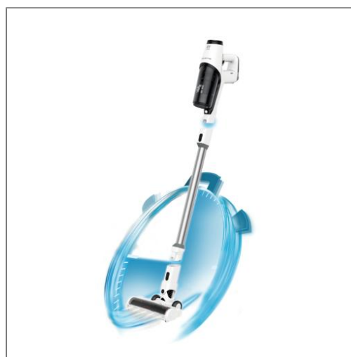
ASPIRATEUR POLYVALENT SANS FIL - X-PERT 3.60