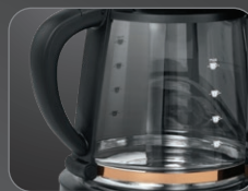
1.4 L (10 cups) Carafe Capacity