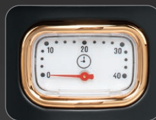
Warm time retro viewing window