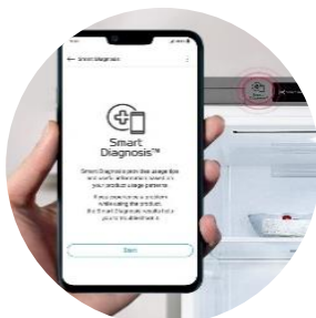
Diagnostic d'erreur instantané