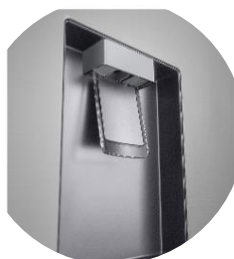
Distributeur d'eau épuré