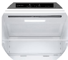
Éclairage Soft LED