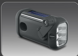
Hand crank dynamo