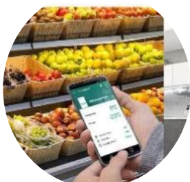
Connectivité Wifi via LG ThinQ