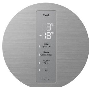
Interface digitale extérieure