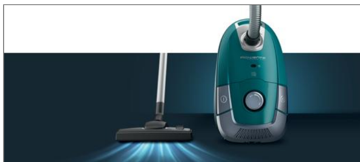
POWER XXL Aspirateur avec sac R03142EA