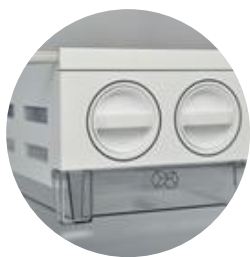
Bac à glaçon IceMatic