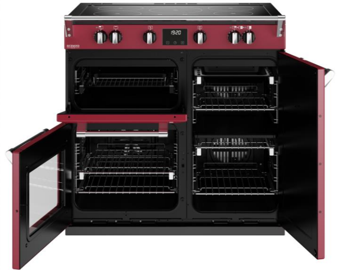
TABLE DE CUISSON 5 FOYERS INDUCTION