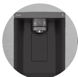
Distributeur d'eau épuré