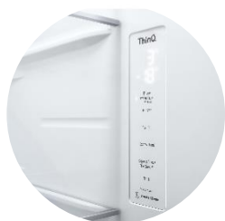
Affichage intérieur discret