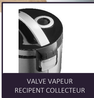
VALVE VAPEUR RECIPENT COLLECTEUR