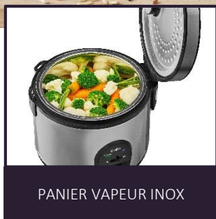
PANIER VAPEUR INOX