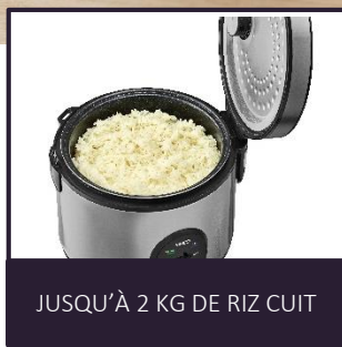
JUSQU'À 2 KG DE RIZ CUIT