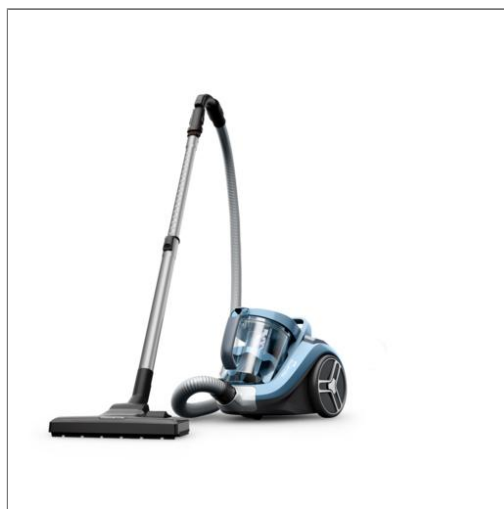
COMPACT POWER XXL Aspirateur sans sac R04B11EA