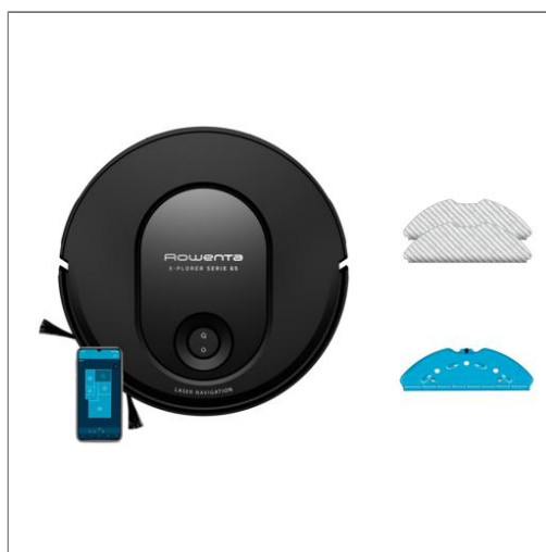
X-PLORER Serie 65, Aspirateur robot laveur, Nettoyage méthodique Aspirateur robot RR8L65WH