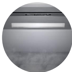
Éclairage Soft LED