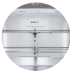
Filtere anti-odeur Pure N Fresh