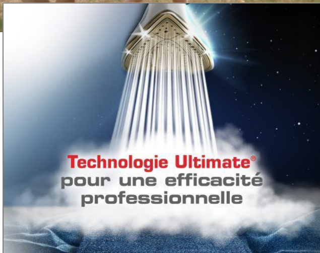
PRO EXPRESS ULTIMATE Centrale vapeur haute pression GV9568CO