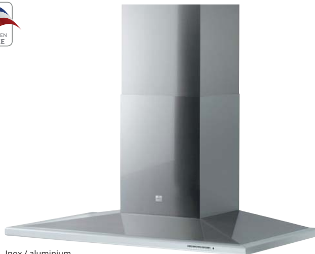
Inox / aluminium