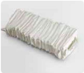
218x55mm Poids Brut 0,43kg Net 0,35kg