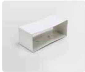
218x55X70mm Poids Brut 0,19kg Net 0,08kg