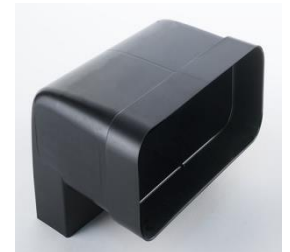
285x230mm Poids Brut 0,6kg Net 0,2kg