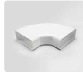
90° 218x55mm Poids Brut 0,33kg Net 0,25kg