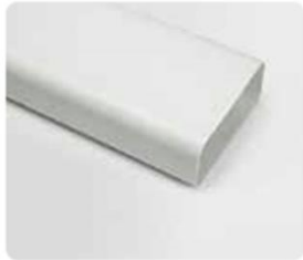
218x55x1000mm Poids Brut 0,21kg Net 0,13kg