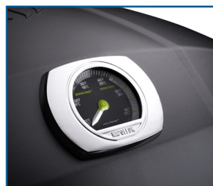
Thermostat à réglage continu