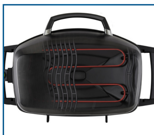
Résistance chauffante 2200 Watt