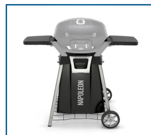
Optionnel chariot + plateaux latéraux