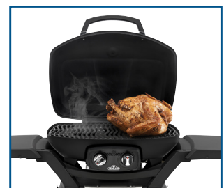
Couvercle extra haut pour aliments volumineux