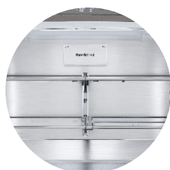
Filtre anti-odeur Pure N Fresh