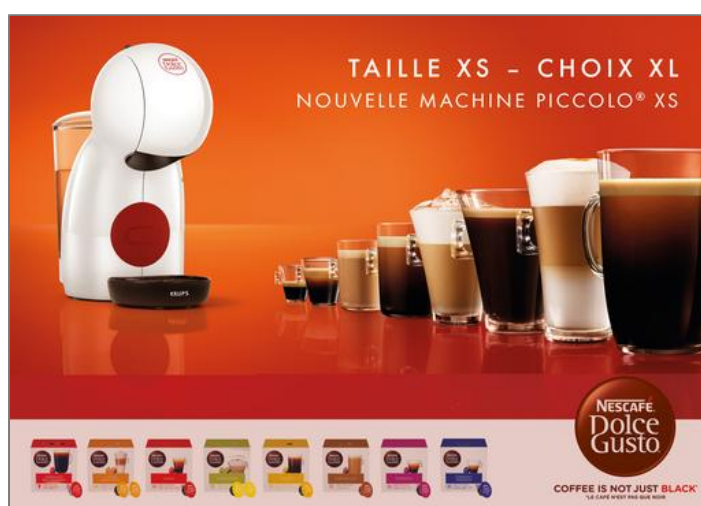
Piccolo XS blanche/rouge Machine expresso Nescafé Dolce Gusto YY5218FD