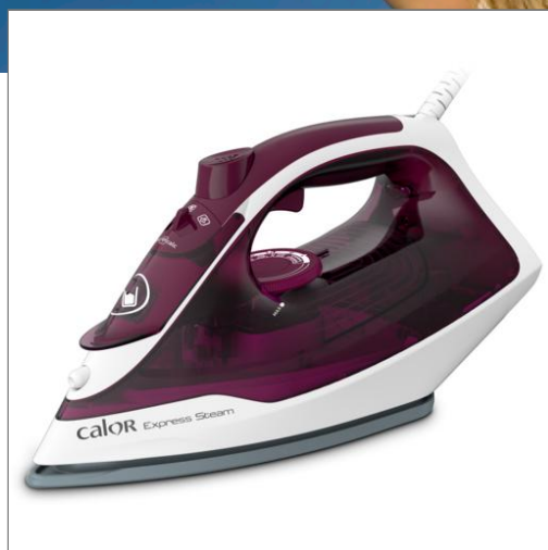
Fer à repasser Express Steam 2400 W Grenat FER VAPEUR FV2835C0