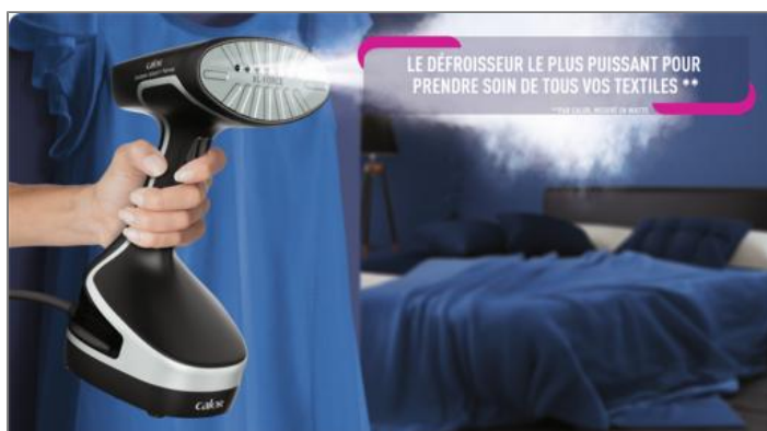
ACCESS STEAM FORCE DT8230C0