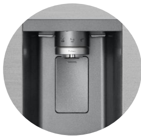
Distributeur d'eau épuré