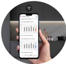
Connectivité LG ThinQ™