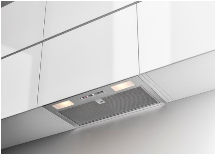
Façade / Cheminée : inox