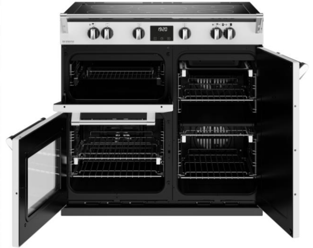
TABLE DE CUISSON 5 FOYERS INDUCTION