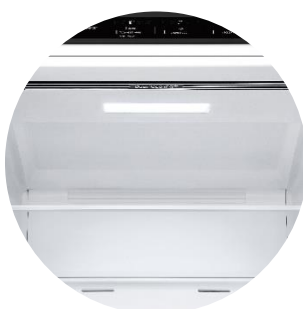
Door Cooling™ & Soft LED