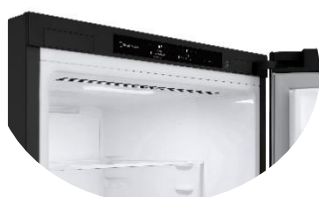
Display intérieur discret