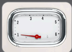
6 Browning temperature setting