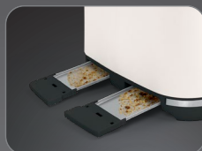
Slide-out crumb tray